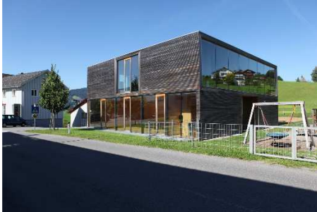
Der Kindergarten in Langenegg, Teil des Exkursionsprogramms im Oktober 2015.