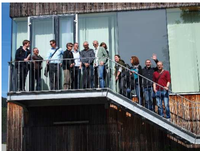
Gruppenfoto vor der Hösshalle Hinterstoder (Akademie Mai 2015)