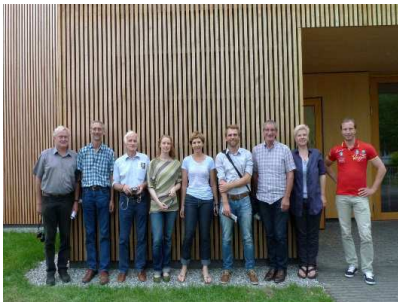
Gruppenfoto in Zwischenwasser, vor dem Kindergarten Muntlix (Akademie Juli 2014).