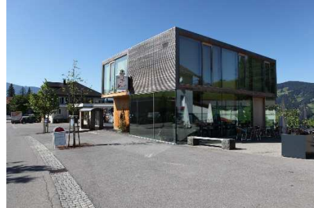
Das Café Stopp in Langenegg, Teil des Exkursionsprogramms im Oktober 2015.