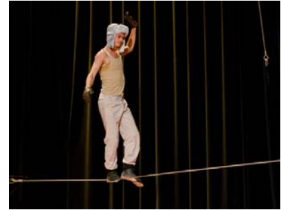
Balanceakt auf dem Drahtseil (Zirkusschule Le Lido aus Frankreich)