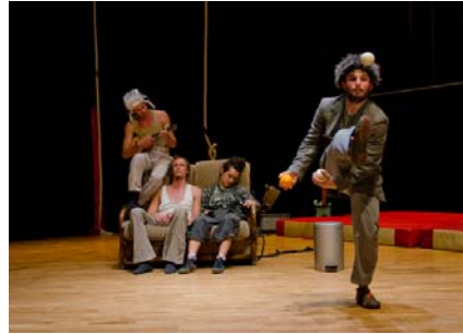
Show der Abschlussklasse der französischen Zirkusschule Le Lido