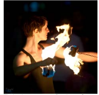
Teilnehmerin auf der Open Stage 2011 mit Feuer-Poi