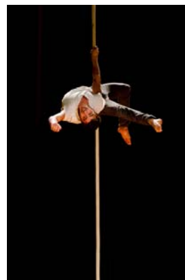
Luftakrobatik am Vertikalseil (Zirkusschule Le Lido aus Frankreich)