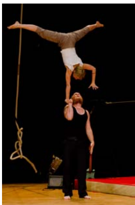
Hand zu Hand-Akrobatik (Zirkusschule Le Lido aus Frankreich)