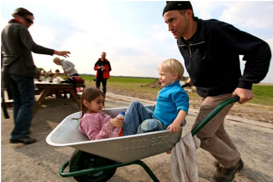
Urban Gardening bei aspern Seestadt PBULIK

Ein Erntefest am 1. Oktober 2011 lädt junge und erwachsene GärtnerInnen zum gemeinsamen Zubereiten und Verzehren der reifen Früchte. Im öffentlichen Garten von aspern Die Seestadt Wiens gedeiht mit der botanischen auch die kulturelle und soziale Vielfalt.