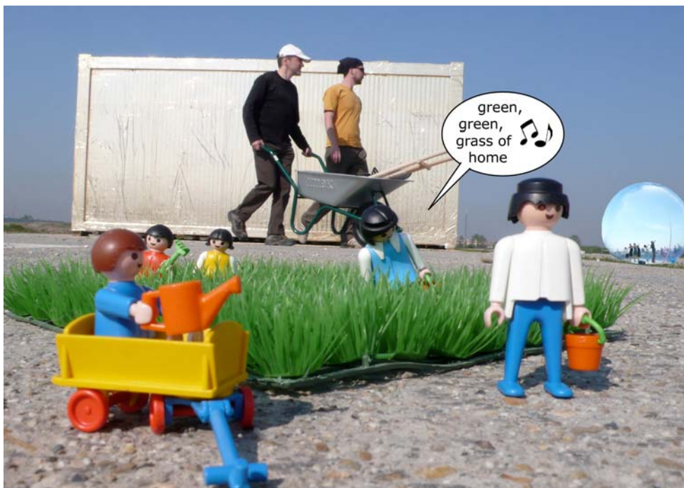
Die erste Siedlerfamilie beim Urban Gardening in aspern Die Seestadt Wien

Unter professioneller Anleitung von Gartenpolylog können Groß & Klein ab sofort jeden Mittwoch und Freitag von 10:00 bis 15:00 Uhr am zukünftigen Seestadtgarten von aspern Die Seestadt Wien mitwirken. Das Projekt „ Urban Gardening “ lädt in die Gartenwerkstatt : Die TeilnehmerInnen pflanzen dort gemeinsam Gemüse, und Blumen, verwandeln Steine, Holz und andere Recyclingmaterialien zu praktischen Gartenelementen wie Kräuterspiralen, Hochbeeten und Biotopen. Speziell für die jüngeren GärtnerInnen gibt es im Sommer einen „ Kinder Garten “, in dem sie spielerisch die Entwicklung eines Gartens erleben. Natürlich wird auch gemeinsam geerntet und gefeiert. Erwachsene verbessern ihr gärtnerisches Wissen in den sommerlichen Gartensprechstunden .