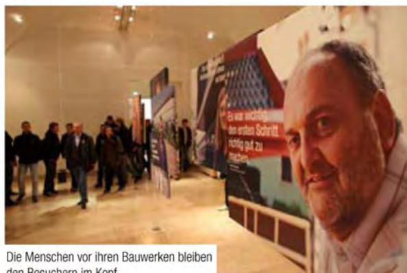
Die Menschen vor ihren Bauwerken bleiben den Besuchern im Kopf.