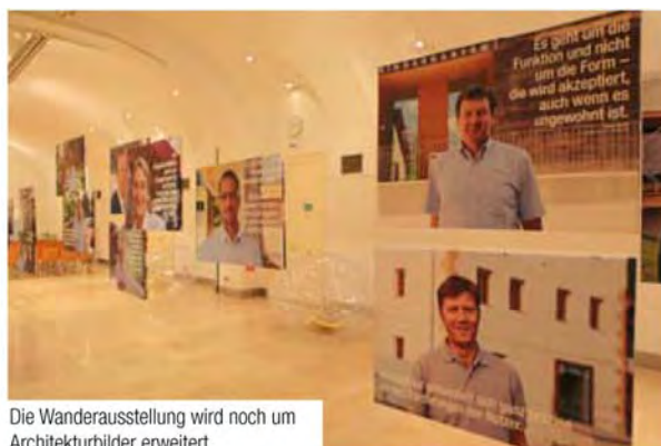
Die Wanderausstellung wird noch um Architekturbilder erweitert.