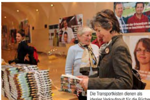
Die Transportkisten dienen als ideales Verkaufspult für die Bücher.